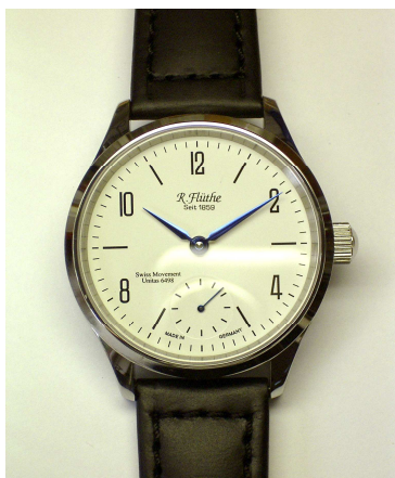
Beispiel einer Seminaruhr für S I

Im Seminar S III wird das weit verbreitete Werk Valjux 7750 komplett zerlegt und Zusammengebaut. Zusätzlich wird es noch veredelt.