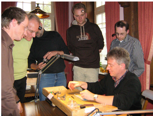
Bei der Arbeit