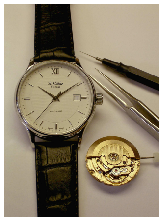
Beispiel einer Seminaruhr für S II

Besuchen Sie unsere Internetseite www.fluethe.de dort finden Sie alle Modelle und umfassende Informationen zu den Seminaren!