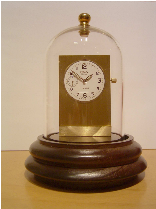
Holz rot/braun gebeizt

Eine schöner Blickfang für Schreibtisch, Sekretär, oder Regal.