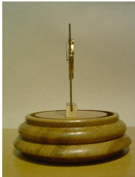
Holz Eiche hell