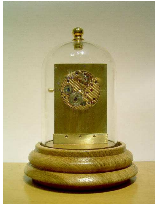
Ein toller Einblick aufs veredelte Werk ist jederzeit möglich.